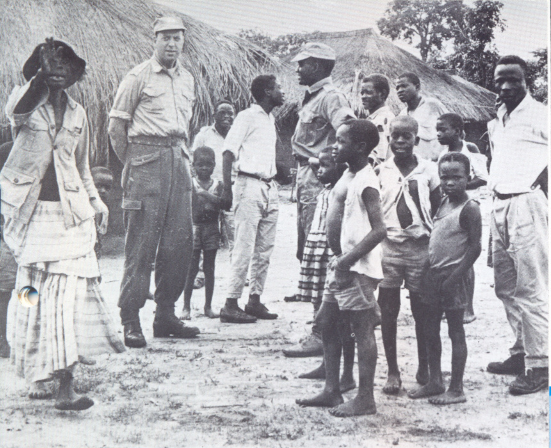
Under fjerne himmelstrøk, Kongo. Norsk FN-observatør i Kashmir.