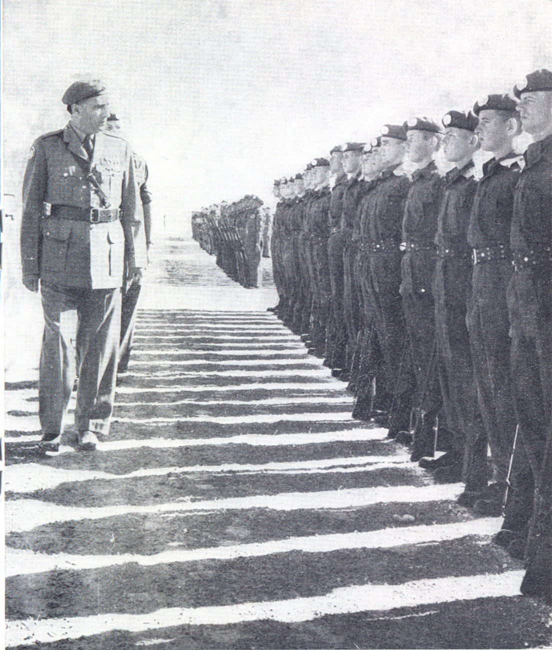
Inspeksjon av FN-styrker.