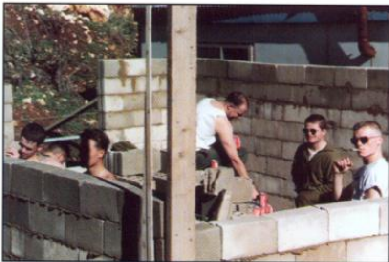
Innsatsvilje! Joda, det har vi! Her skal vi bygge tørke/trimrom i 4-25 LL. Dette skal gjøres ved egen innsats. Bygget er ferdig, unntatt taket som bataljonen skal sette opp.