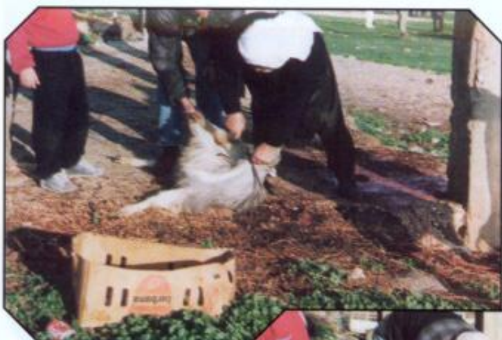
Markedet kan være et syn for guder! Her er et eksempel, slakting av geit. Kniv på strupe!