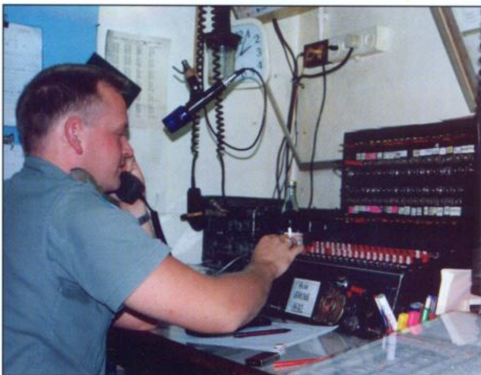
Korporal Oppsann(e) i full konsentrasjon

Til vår alles fortvilelse blir vi etter hvert ganske drevne i såkalt «kvalifisert synsing». For om vi ikke har snøring på det det spørres etter føler vi oss forpliktet til å gi et sannsynlig svar. Men det har dere vel ikke skjønt før nå?? Og det skal jo også sies at vi har hatt bortimot stålkontroll på det meste. Om dette opprettholdes i det sivile, vites ikke. Uansett vil vi takke dere alle for en flott kontingent XXXII, og lykke til videre! «9-mottatt slutt! Øh...gjenta over!»