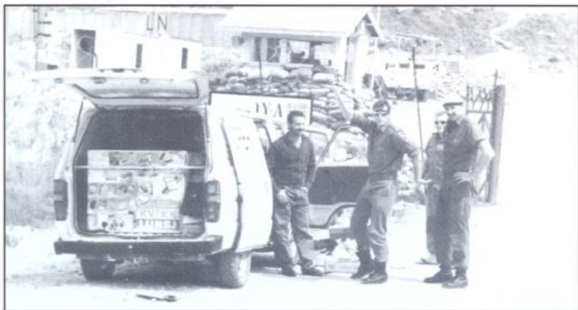
Tre av kompaniets ivrige «kjøpetryner» redder dagen for «sugeren».