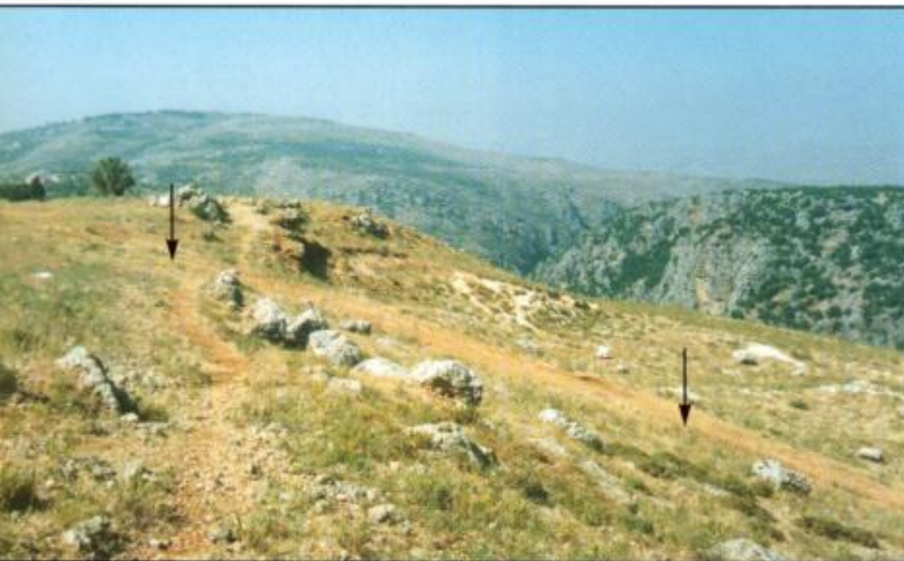
Samlingspunkt 2 er i venstre kant av bildet. Det første granat-nedslaget var i bildets nedre høyre hjørne.