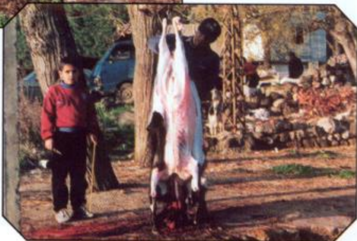
«Ballong-trikset» gjør det tydeligvis lettere å få skinnnet av! Som sagt, et syn for guder!