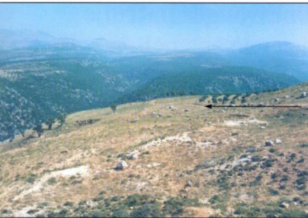
Ytterst på kanten, midt på bildet, er A2L-punktet. Patruljen løp oppover kjerreveien (mot venstre på bildet) for å komme i sikkerhet.