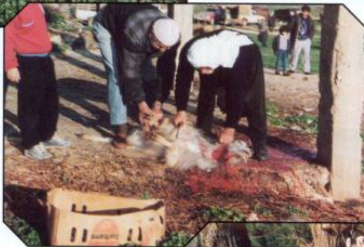
Strupe over, geit ferdig ferdig! Neste skritt, snitt i bakfot, og geita blir blåst opp som en ballong!