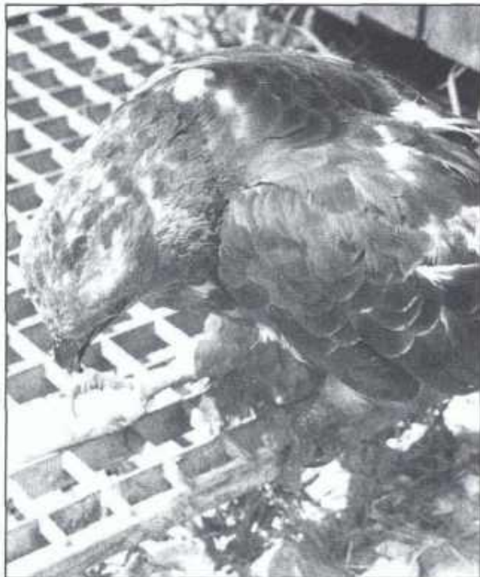
NMC - det nye "Ørneredet"? Leiren er iallfall kvalifisert for det etter at de i 7-8 måneder har hatt en ørn i pensjon.

Birdy har gått fritt rundt inne på leirområdet. Han er blitt stadig bedre, og prøver seg gjerne på en liten flytur en gang i blant, med varierende hell. Sannsynligvis forlater han NMC så snart styringen er gjenopprettet.