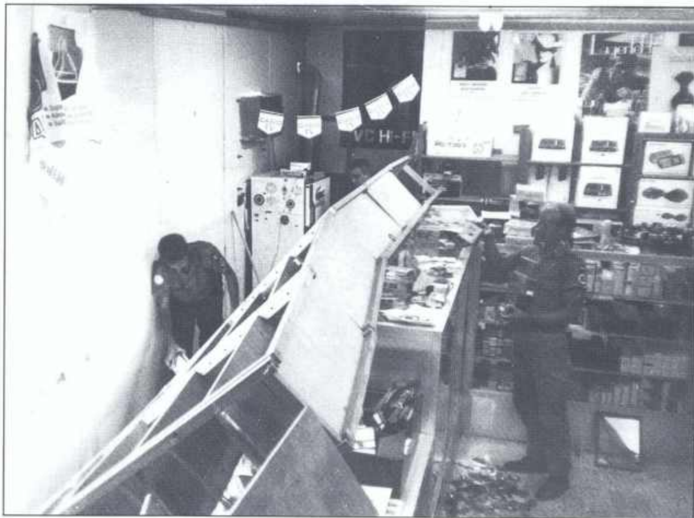
Det var kaos inne i PX'en etter at tankbilen hadde rygget på veggen.

TIBNINE: De fikk seg et sjokk, de som sto inne på PX'en i NMC en dag i september. Plutselig braste en av kompaniets tankbiler gjennom veggen. 10-15 meter med hyller bak disken veltet; først den ene, så fulgte de andre etter.