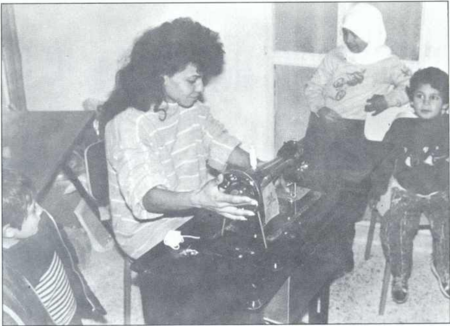
Kvinneresenteret i Tibnin er et av flere prosjekter der humanitærkomiteen i NorMaintCoy har formidlet hjelp. Dette prosjektet er etterhvert glidd inn i bybildet som en helt naturlig del.