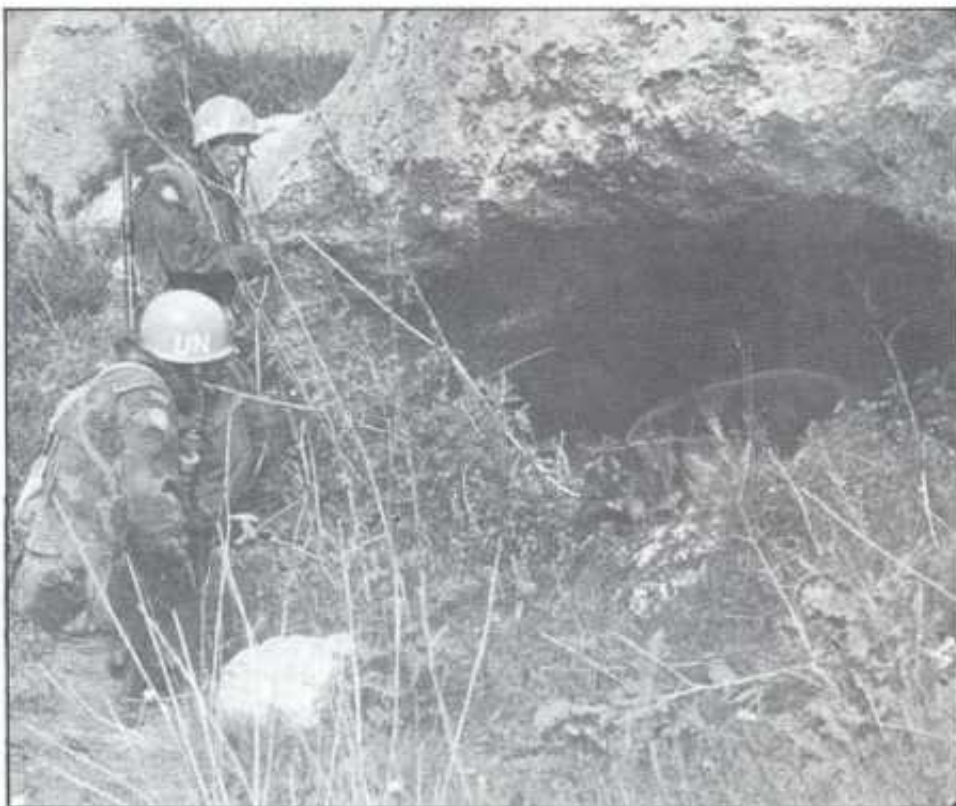
Norbatts hunder ble satt inn i områder med mange huler. Hundenes hørsel og luktesans er i slike tilfeller helt avgjørende.