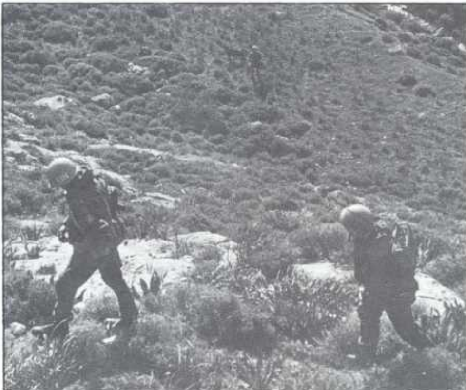
"Operasjon Higgins" i en av dalene i Fijibatt. Her er en av Norbatts åtte patruljer under søk-operasjonen.