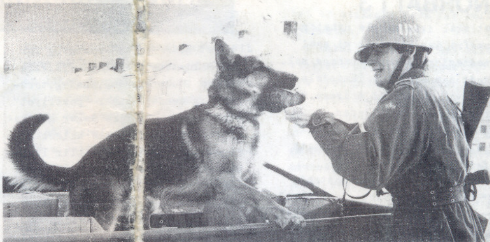
Demonstrasjon av "sprengstoffhunden".